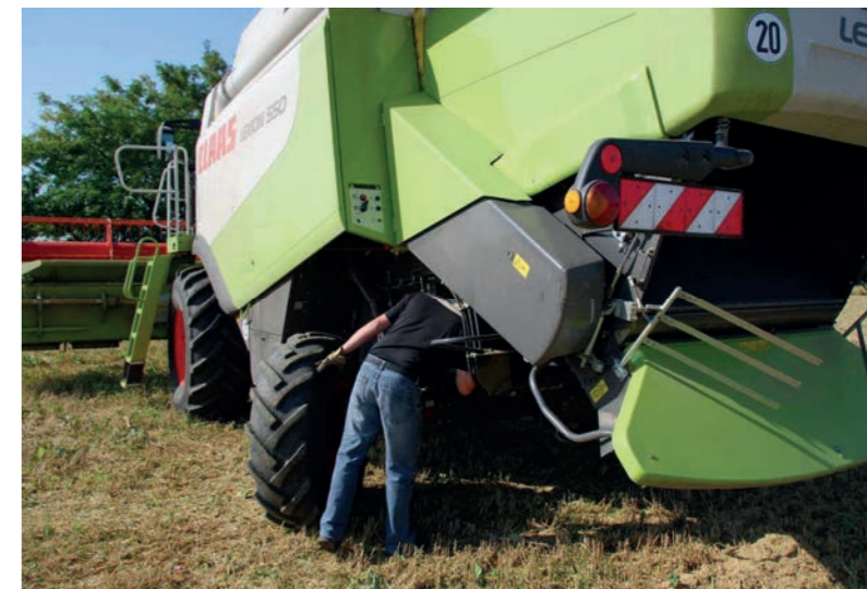
Störungen nur bei abgestellten Antrieben beseitigen

Der verantwortliche Unternehmer hat seine Mitarbeiter in den relevanten Themen der Arbeitssicherheit zu unterweisen. Auch wenn diese „vom Fach“ sind, werden mit einer Unterweisung der Standpunkt des Arbeitgebers verdeutlicht und bestehende Wissenslücken der Mitarbeiter geschlossen. Das persönliche Gespräch über Gefahren während der Erntesaison hilft den Mitarbeitern, sich die Risiken zu verdeutlichen und führt zur Sensibilisierung. Die Unterweisung sollte unbedingt schriftlich dokumentiert werden.