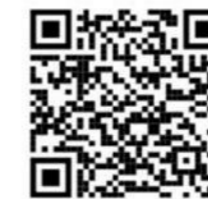
2: Apple App Store QR Cde